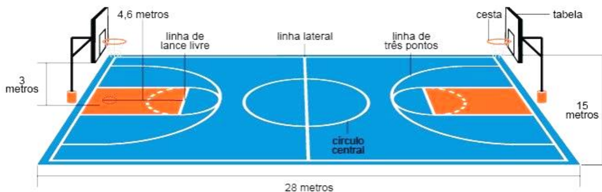
Linhas e marcações da quadra de basquete

O basquetebol é jogado em uma quadra retangular, medindo 28 m de comprimento por 15 m de largura. Nas duas extremidades da quadra, estão colocados os cestos a uma altura de 3,05 m do solo.